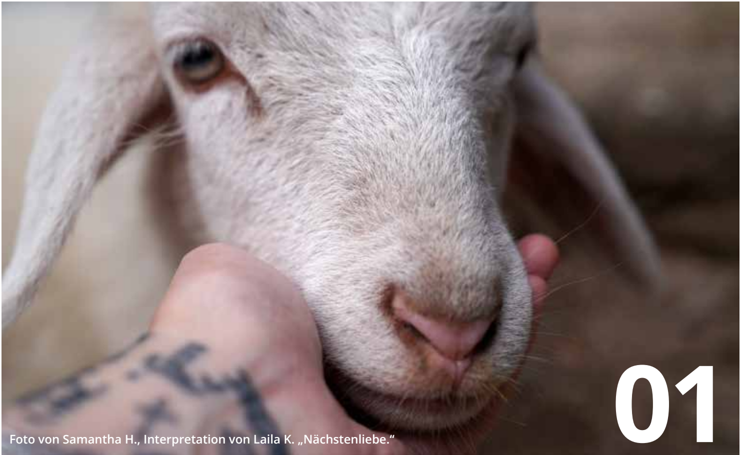
Foto von Samantha H., Interpretation von Laila K. „Nächstenliebe.“