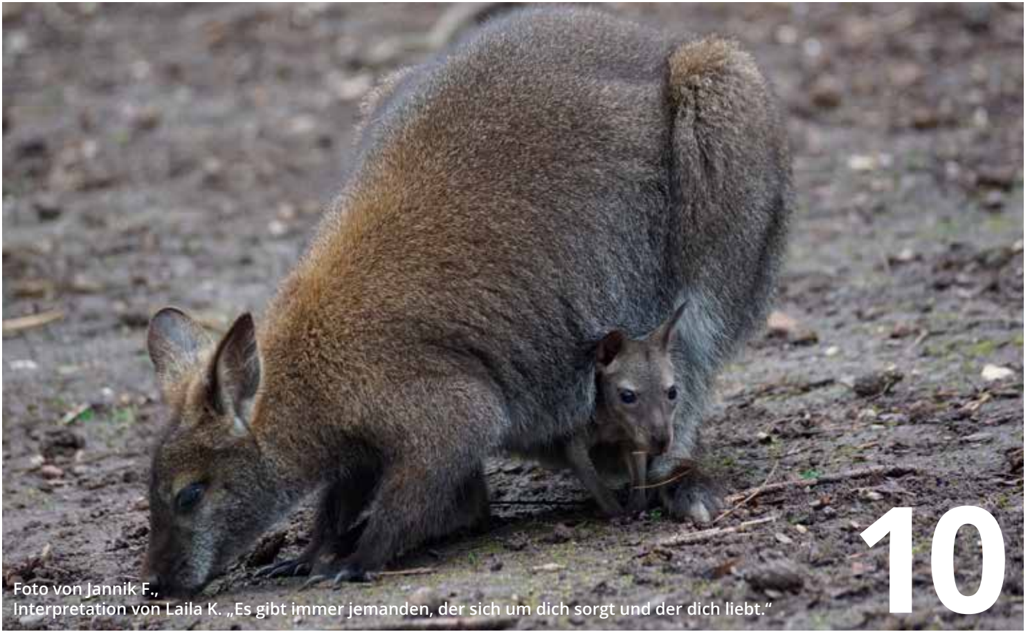
Foto von Jannik F., Interpretation von Laila K. „Es gibt immer jemanden, der sich um dich sorgt und der dich liebt.“