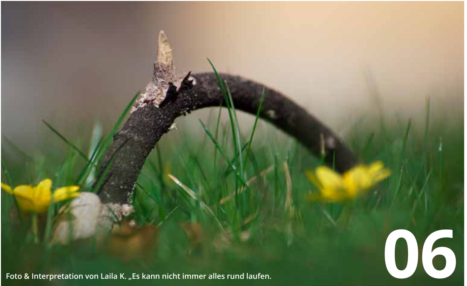
Foto & Interpretation von Laila K. „Es kann nicht immer alles rund laufen.“