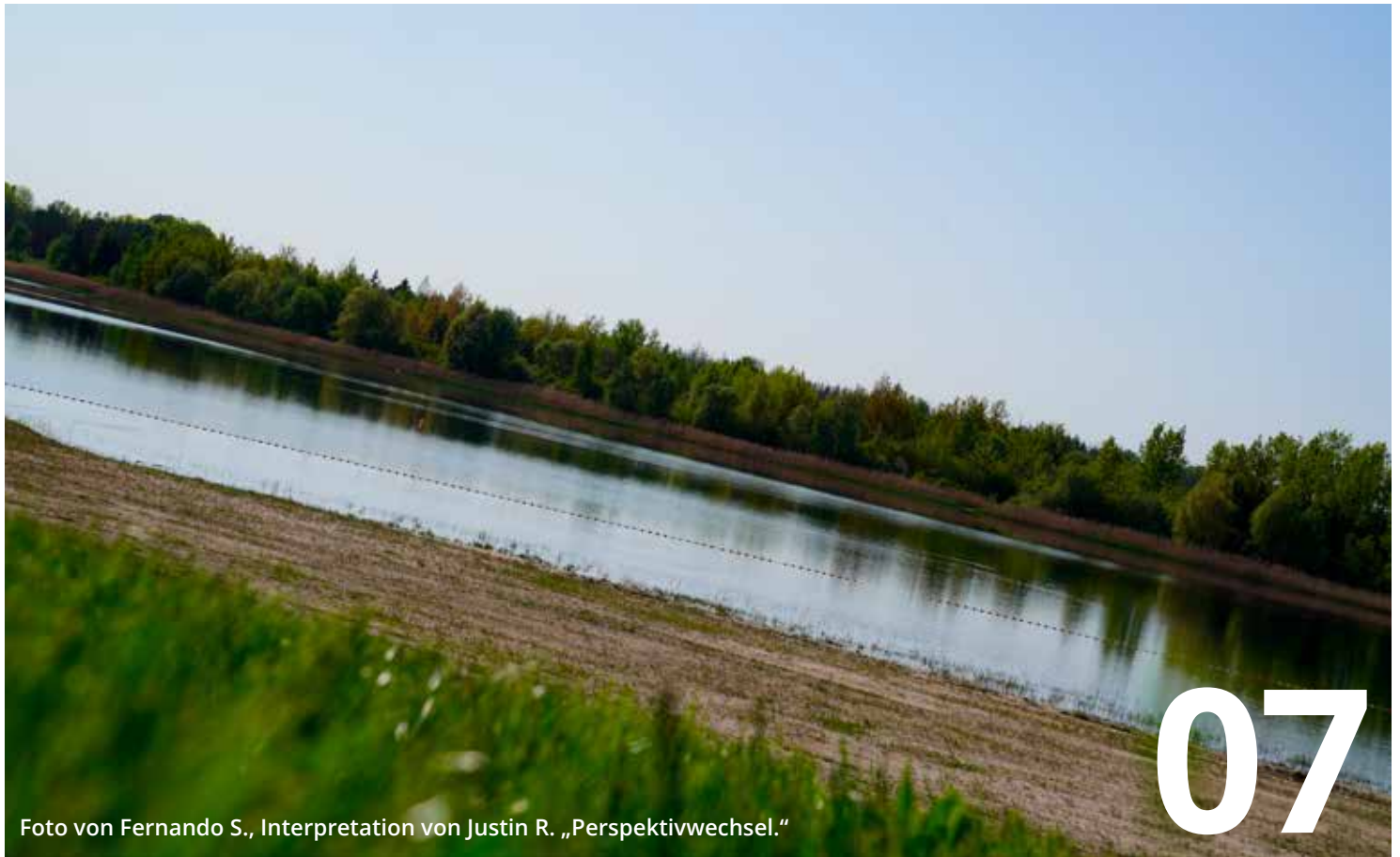
Interpretation von Justin R. „Perspektivwechsel.“