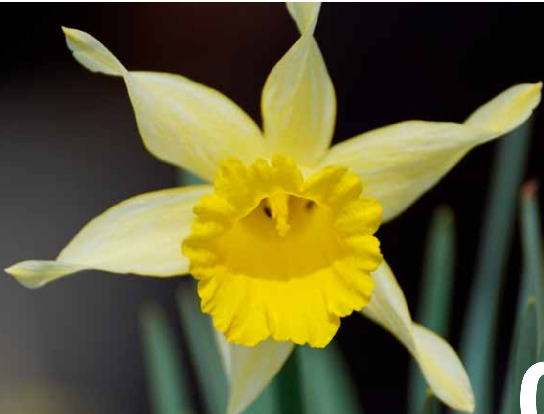
Interpretation von Julienne L. „Jeder Mensch sollte aufblühen und sich entfalten können.“